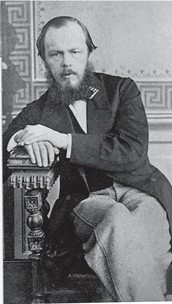
Михаил (слева) и Федор (справа) Достоевские. Петербург. 1862–1863.